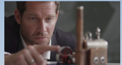
Filmszene aus „Die Stille Revolution“